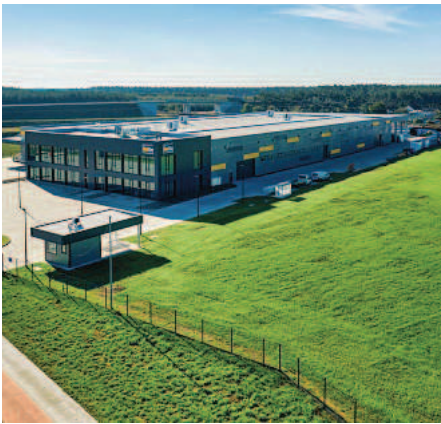
Werk Neubau.

Das neue Fertigungswerk in Leszno hat die UP-Gruppe im 2. Halbjahr 2020 erfolgreich in Betrieb genommen. An diesem Standort werden sowohl Kunststoff- als auch Aluminium-Elemente für den Fachhandel gefertigt. Das unter deutscher Leitung geführte Werk ist eines von drei Produktionsstandorten der Unternehmensgruppe und zusammen mit dem Standort Leipzig ein wichtiges Bindeglied zum Stammwerk im rheinland-pfälzischen Maßweiler.